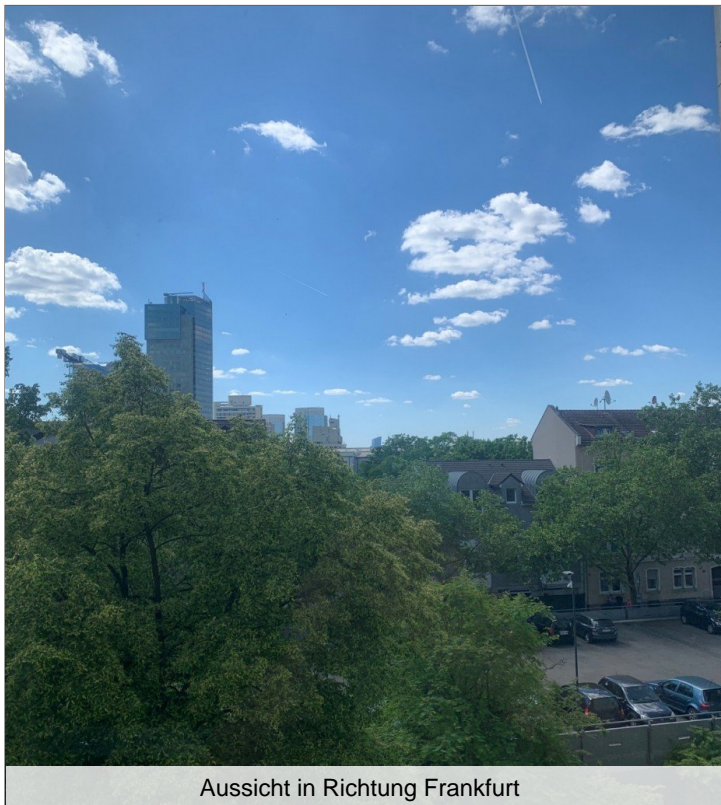
Aussicht in Richtung Frankfurt