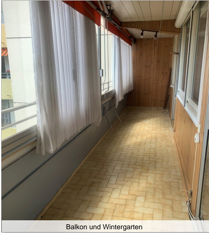
Balkon und Wintergarten